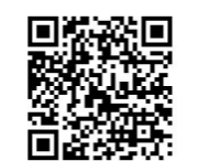
【申込み専用ページ】

5月9日(木) 17:00まで 茨城県県西生涯学習センターのホームページにアクセスし「県民大学申込み」をクリックしてください。